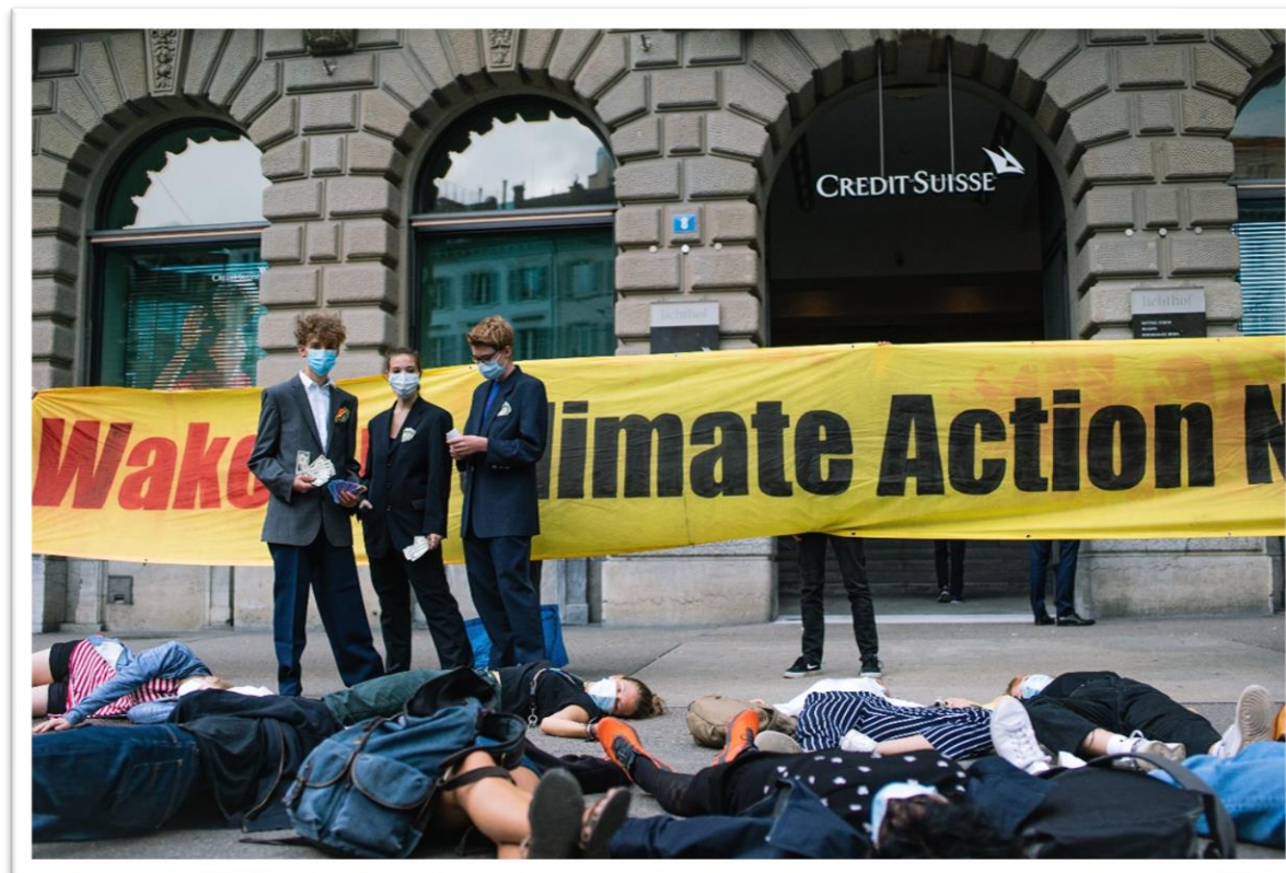
Paradeplatz im Juli 2020

Weshalb senden wir die Schweizer Finanzinstitute in die “Abschlussprüfung”?